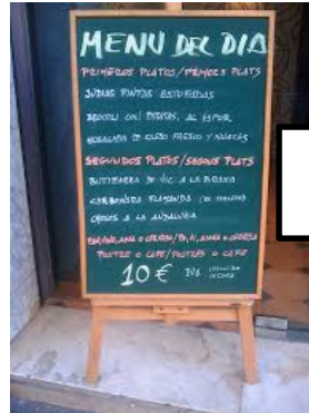
Escriure els menús dels restaurants