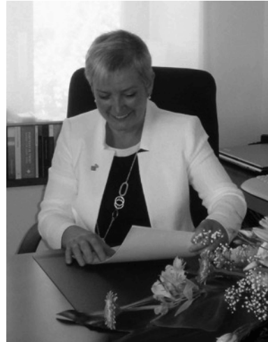
L'actual alcaldessa és la Sra. ....

El govern municipal és format per l'alcalde i un grup de regidors que s'encarreguen dels diferents serveis, com ara els mitjans de transport, el medi ambient o la neteja dels carrers. Cada quatre anys, els ciutadans i les ciutadanes del municipi elegeixen els regidors i les regidores, els quals, al cap d'uns quants dies, escullen l'alcalde o l'alcaldeessa.