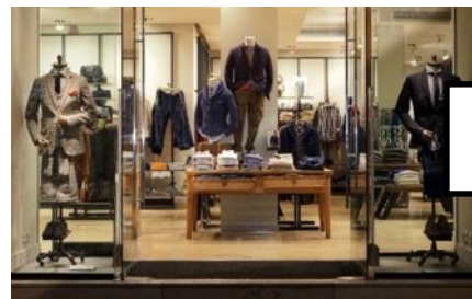
Muntar els aparadors de les botigues perquè quedin ben bonics