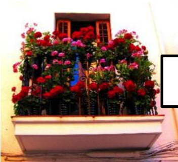
Posar flors als balcons de les cases particulars per fer més bonic el poble