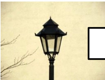
Procurar per la correcta il·luminació de la via pública