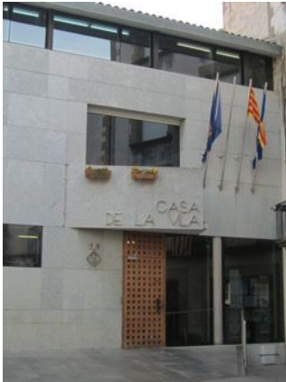
Casa de la vila de C.....

que hi habiten. L'alcalde o l'alcaldeessa és la persona que té més responsabilitat de l'ajuntament, i els regidors i les regidores són els qui ajuden l'alcalde a governar.