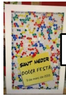
Vetllar per l'art i la cultura de la ciutat, oferint programacions de qualitat