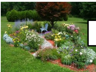
Tenir cura dels jardins públics