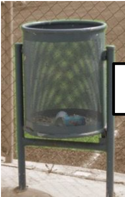
Buidar les papereres dels carrers