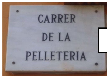
Posar els rètols dels carrers